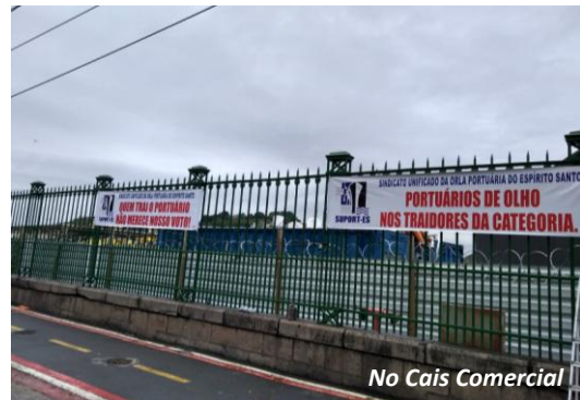
No Cais Comercial